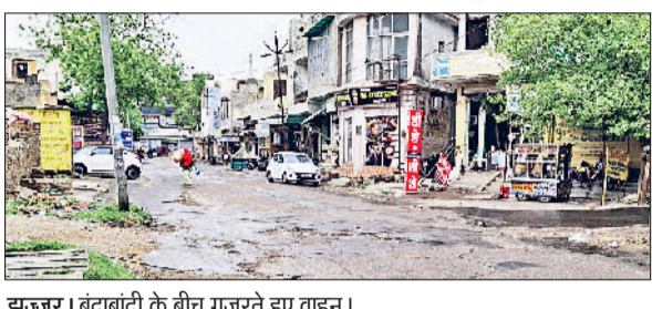
झंझर। बूदाबांदी के बीच गुजरते हुए वाहन।

हरिभूमि न्यूज। झंझर। रूक कर कभी बूदाबांदी तो कभी हल्की बारिश होने लगी। जिसके कारण मौसम खुशनुमा हो गया और तापमान में भी गिरावट दर्ज की गई। रविवार को अधिकतम तापमान 37 डिग्री सेल्सियस और न्यूनतम तापमान 27 डिग्री सेल्सियस दर्ज किया गया। विशेषज्ञ आगामी दिनों में भी मौसम परिवर्तनशील रहने का अनुमान लगा रहे हैं।