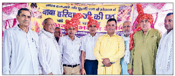
बहादुरगढ़। अतिथियों का स्वागत करते आयोजक।