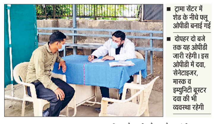
हरिभूमि न्यूज। बहादुरगढ़

एंबुलेंस सुविधा, टेस्ट किट, ऑक्सीजन सिलेंडर की जानकारी लेते हुए ऑक्सीजन प्लांट का निरीक्षण किया। अस्पताल में शनिवार को नौ व रविवार को छह लोगों को रेपिड टेस्ट किए गए।