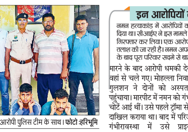
रेवाड़ी। हत्या के आरोप में पकड़े गए आरोपी पुलिस टीम के साथ।