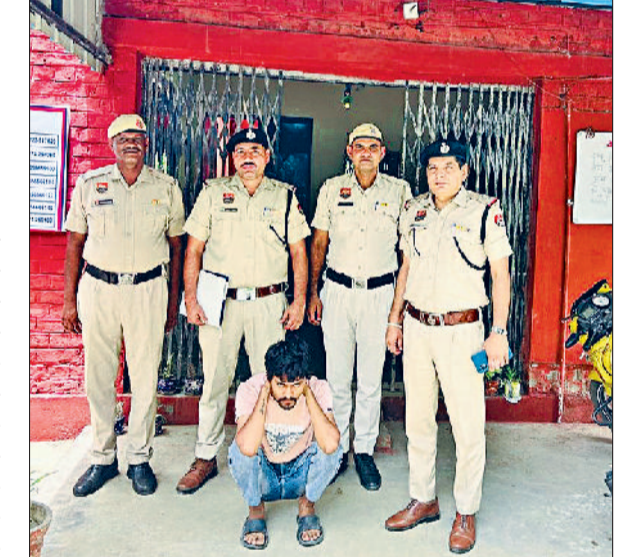
रेवाड़ी। हत्या का आरोपी पुलिस टीम के साथ।

■ रिमांड के दौरान उससे हत्या में प्रयुक्त हथियार बरामद किया जाएगा