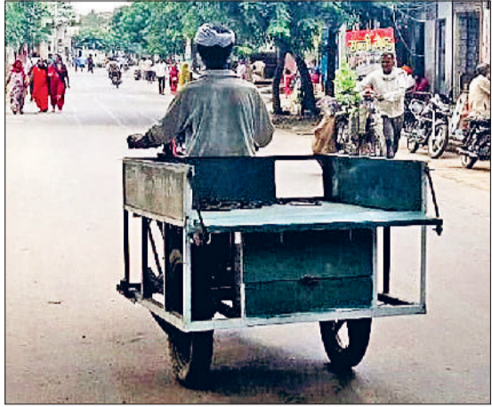
इज्जर। शहर की सड़क से गुजरते हुए जुगाडू वाहन।

कंडम बाइक के पीछे रेहड़ी जोड़कर उन्हें लोडिंग क्लीक बनाया गया है। उसे लोग जहां अपना सामान ढोने के लिए उपयोग में लाते हैं वहीं अपने परिवार के सदस्यों को भी एक जगह से दूसरी जगह छोड़ने में इसका प्रयोग कर रहे हैं।