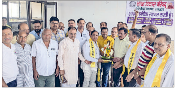
बहादुरगढ़। भाविप पदाधिकारियों को स्मृति चिह्न देते अस्पताल के पदाधिकारी।