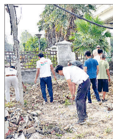
बहादुरगढ़। ग्रीन बेल्ट में श्रमदान करते पर्यावरण प्रेमी।