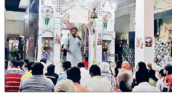
झज्जर। भजनों के माध्यम से बाबा की महिमा का गुणगान करते हुए गायक कलाकार।